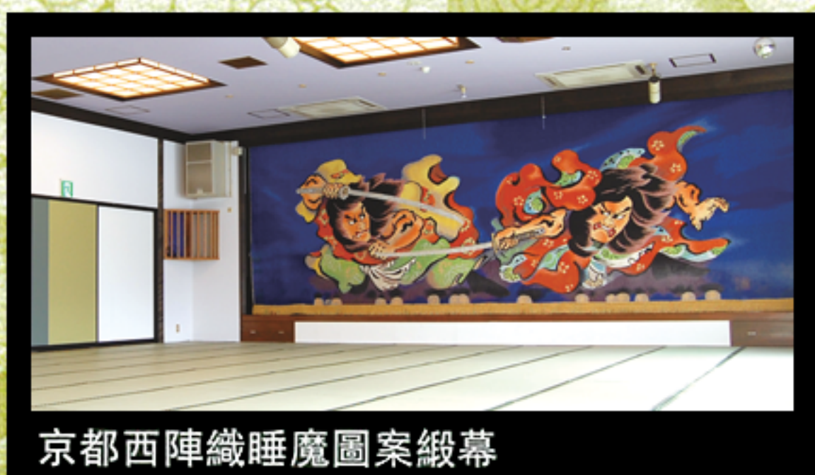
京都西陣織睡魔圖案緞幕